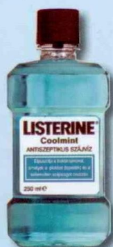
LISTERINE® Coolmint Antiszeptikus szájvíz hűsítő mentol ízzel

A LISTERINE® alkalmas a mindennapi, hosszú távú használatra. Nem színezi el a fogzománcot és nem okoz ízérzés-zavart sem. Használja naponta kétszer a LISTERINE®-t fogmosás után, hogy védelmet biztosítson a lepedékkel szemben.