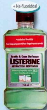
LISTERINE® Teeth & Gum Defence Antiszeptikus fog- és ínyvédő szájvíz