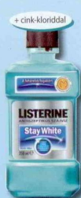
LISTERINE® Stay White Antiszeptikus szájvíz