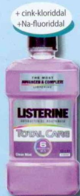
LISTERINE® Total Care Antiszeptikus szájvíz 6 előny egyben