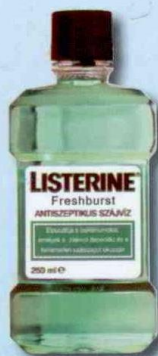
LISTERINE® Freshburst Antiszeptikus szájvíz friss ízzel